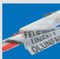
Schilder auf Wunsch auch mit individueller Beschriftung möglich