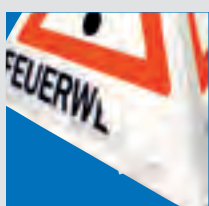
leicht wechselbare Klettschilder