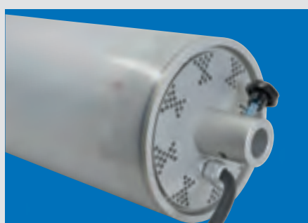
Aufnahme für Normzapfen