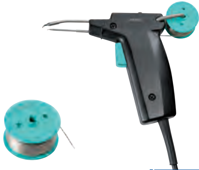
Kartuschen C130 auf Seite 39