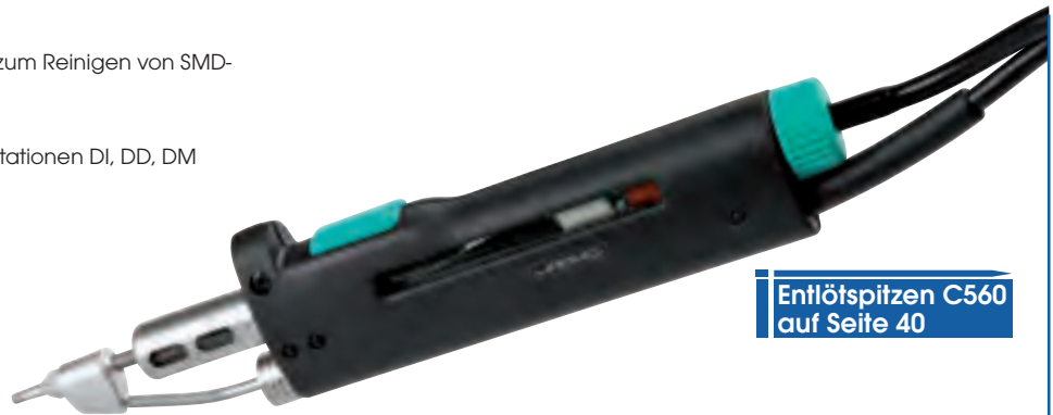
Entlötspitzen C560 auf Seite 40

DR-A mit Glasbehälter und der Spitze C560-003